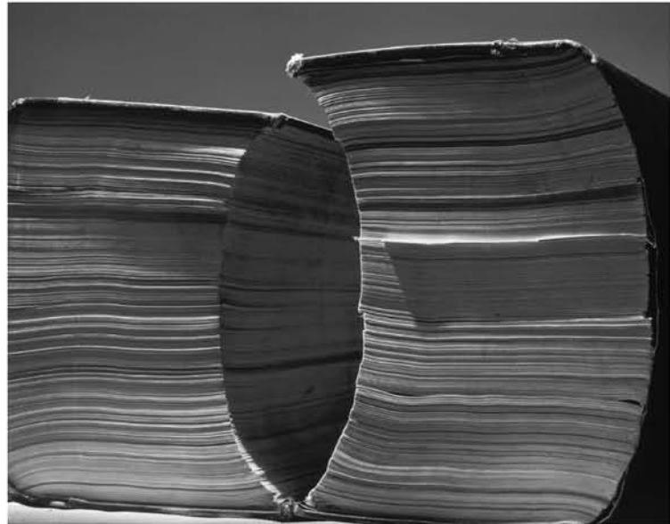
◀4 ▲5 ▼6